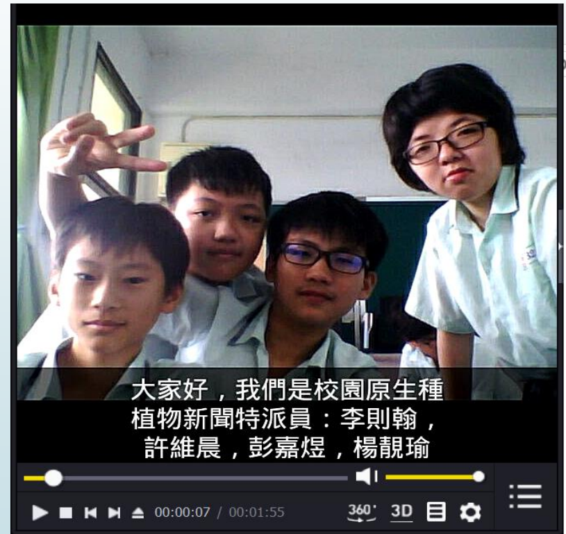
原生種植物影片作品