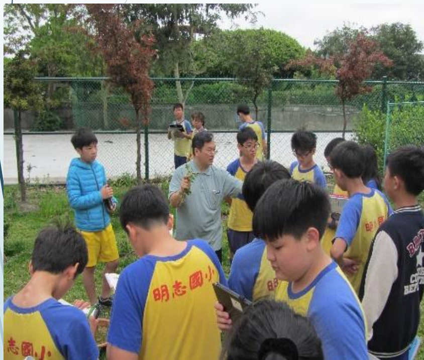
認識校園原生種植物復育區