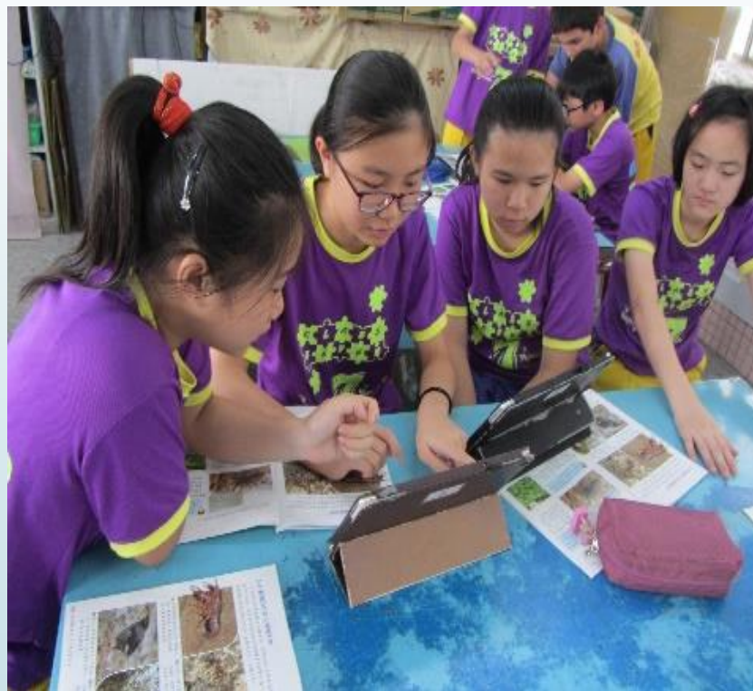
製作校園原生種植物簡報