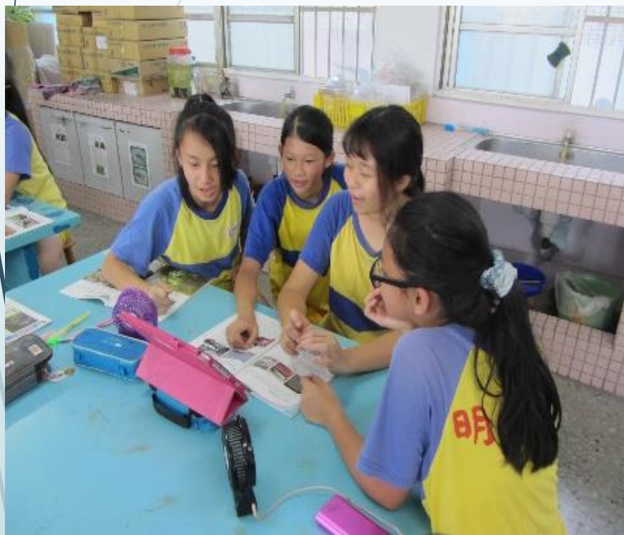
小組合作查詢資料