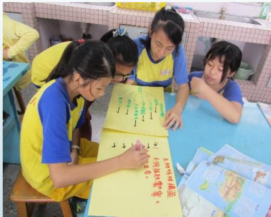
小組討論地球上多樣的生物與環境