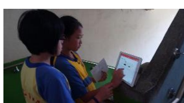
地下室樓梯間錄音

解說錄音，卻花了我們好多時間。有時說不順、有時是雜音太多。我們還到地下室去錄音，沒想到回音，效果也不好。只好利用上科任課的時間，大家不在教室裡時，分組慢慢的錄製。最後老師還想到一招，利用午休時，要大家坐到地板上，減少桌子、椅子的摩擦聲。要完美無雜音，真是不容易。