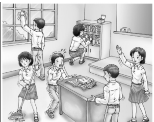
七上八下 七手八腳